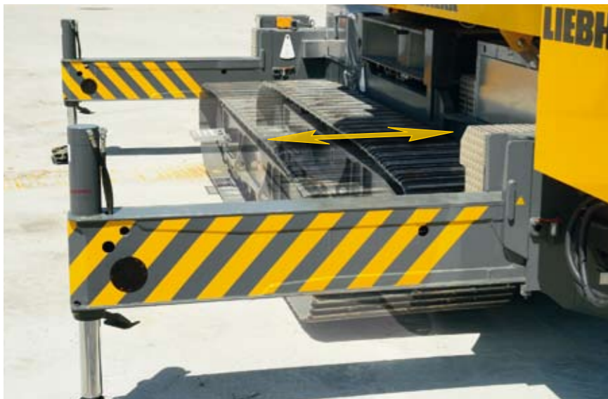
Praxisorientiert: Anpassungsfähige Standbasis beim Versetzen auf der Baustelle durch verschiebbare Raupen.