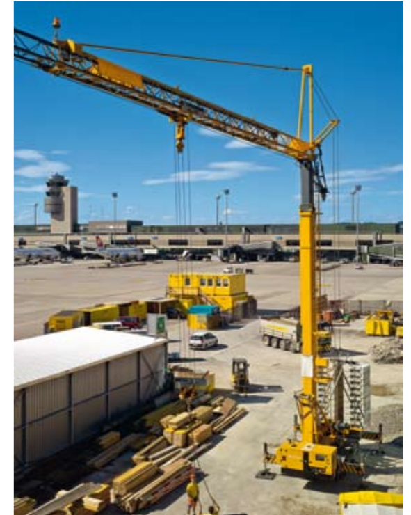
Flexibel: Der 32 TTR - Höchste Anpassungsfähigkeit durch teleskopierbaren Turm und Ausleger.