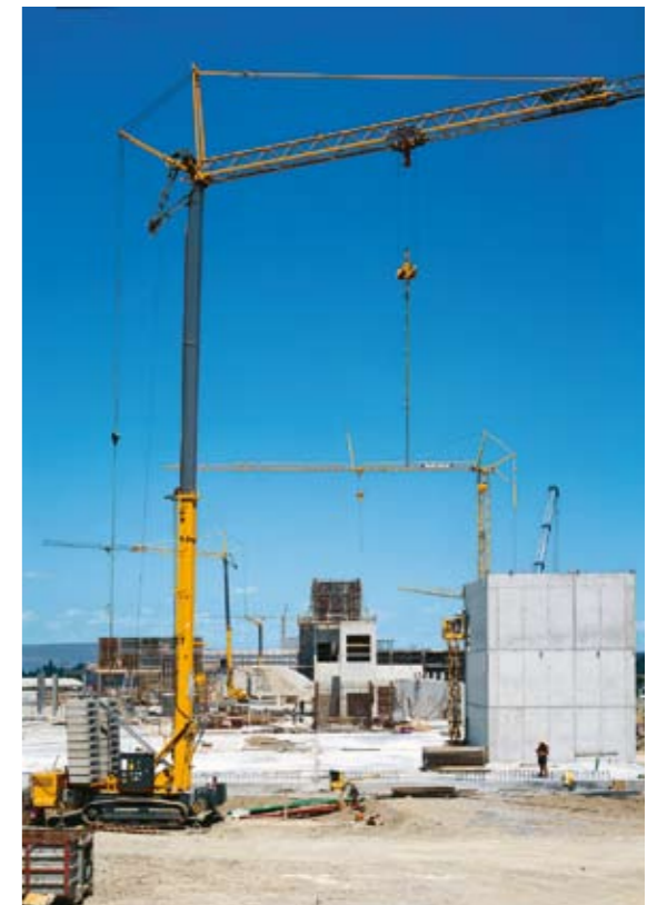
Schneller Standortwechsel: Verfahren auf Großbaustellen.