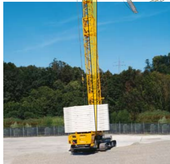
All-Terrain: Quer-Neigungen bis zu 7%...