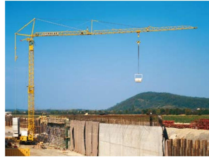
Wirtschaftlich: Nur ein Raupenkran ist auf einer langgezogenen Tunnelbaustelle nötig.