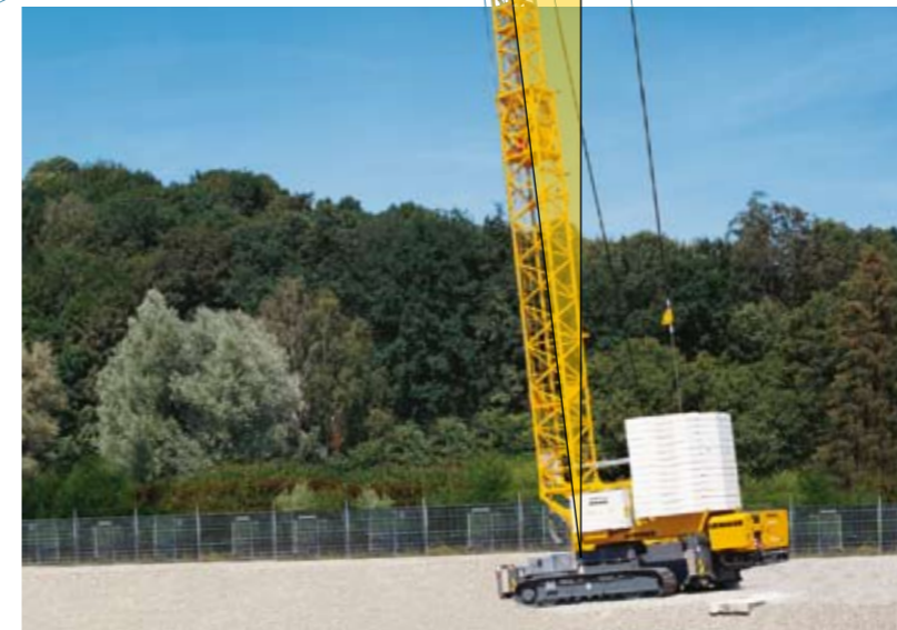
... und bis zu 10% Längs-Neigungen sind für Liebherr-Raupenkrane kein Problem.