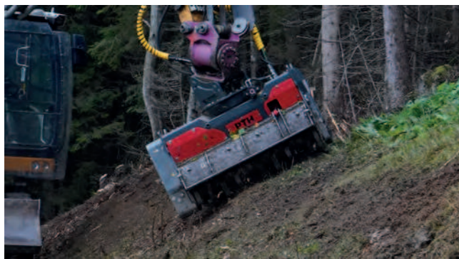
MC-B 1150 hydraulisch

Ideal für Einsätze wie Steinfräsen, Forstmulchen, Bankettfräsen oder Wurzelstockentfernung.