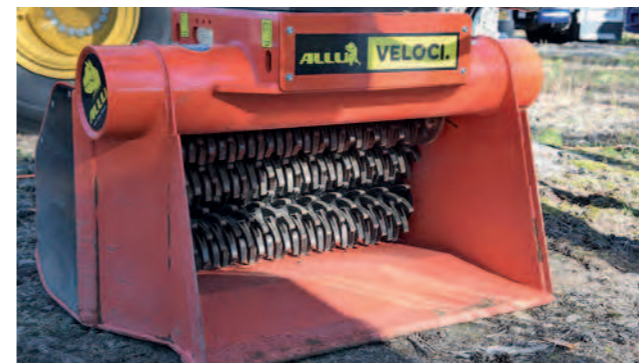
Veloci VS 3-05 / VS 3-09 FS20

Kompakte Anbaugeräte für das Sieben verschiedener Materialien sowie das Verfüllen von Rohrleitungen und Kabeln.