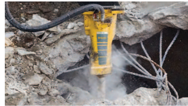
SB 102 / SB 152

Die kompakten SB-Hydraulikhämmer sind einfach zu bedienen und eignen sich für eine Vielzahl von Anwendungen.