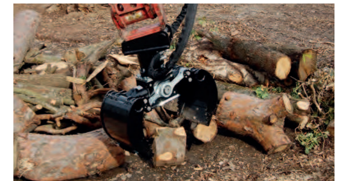
SG 2030 / SG 3535

Der Mehrzweckgreifer deckt vom Setzen von Naturstein bis zum Bewegen von Schüttgütern viele Anwendungsbereiche ab.