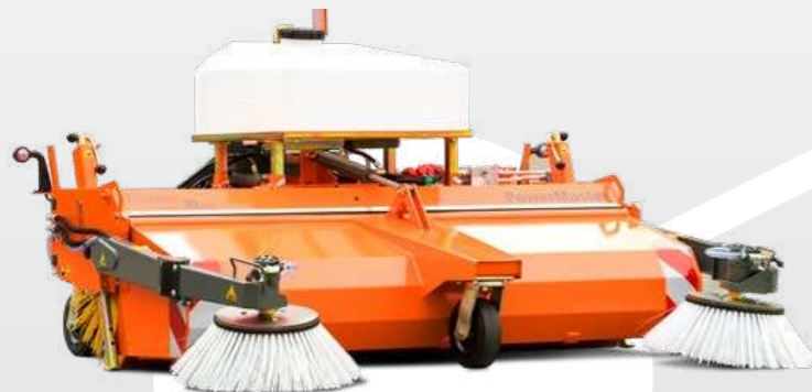
Power Master Bema 30 Dual