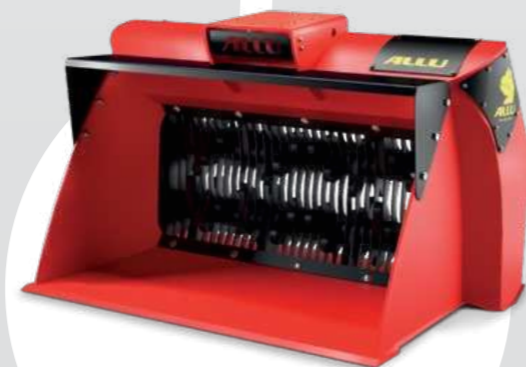
ALLU DL 2-17 TS16/32 S