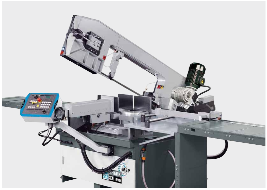
ZUBEHÖRE - SEITE 23 - N° 01 - 02 - 03 - 07 - 11 - 12 - 31

SHARK 512 SXI evo, halbautomatische elektrohydraulische Bandsägemaschine für Schnitte von 60° links bis 60° rechts. - Vielseitig anwendbare Maschine mit einem Band von 4640x34x1,1 mm für das Zuschneiden von Rohren, Profilen und Trägern bis zu einem max. Schneidbereich von 510x320 mm auf 0°. SCHNITZIKLUS: - Halbautomatischer Betrieb: Der Bediener positioniert manuell das Werkstück und startet die Maschine. Bei Zyklusbeginn erfolgt: - Schraubstock schließt sich und Motor läuft an - Sägekopf senkt sich für den Schnitt - Motor schaltet ab - Sägekopf hebt sich - Schraubstock öffnet sich. - ZYKLUS DOWN-UP Im halbautomatischen Zyklus ermöglicht die Taste DOWN den Sägekopf und die Rotation des Sägebandes bei Schnittende zu stoppen indem der Schraubstock geschlossen bleibt. Damit der Sägekopf wieder hochfährt und der Schraubstock öffnet muss die Taste UP auf dem Bedienfeld gedrückt werden.